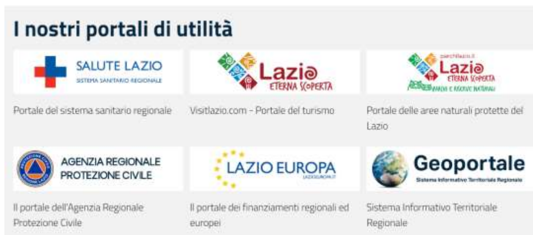
Fig. 2.4 – Banner presente in tutte le pagine del portale istituzionale della Regione Lazio

Se si intende rafforzare la connessione tra il portale Lazio Europa e i siti istituzionali correlati al POR FSE, potrebbe essere utile prevedere anche dei link che rimandino, in un percorso in senso contrario, dalle pagine del POR FSE di Lazio Europa ai siti istituzionali della Formazione, Lavoro e Sociale e Famiglia .