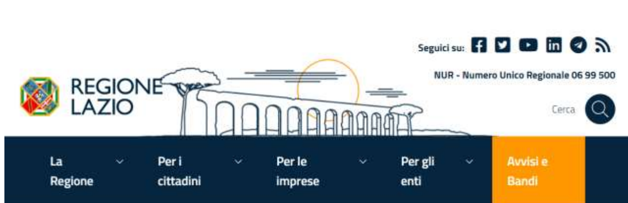
Fig. 2.3 – Articolazione del menù principale del portale istituzionale della Regione Lazio

Il portale regionale rappresenta uno strumento particolarmente completo che consente una facile fruizione di contenuti differenziati in base alla tipologia di utenza selezionata, in grado di sostenere un'azione informativa e comunicativa efficacemente mirata dell'Amministrazione regionale.