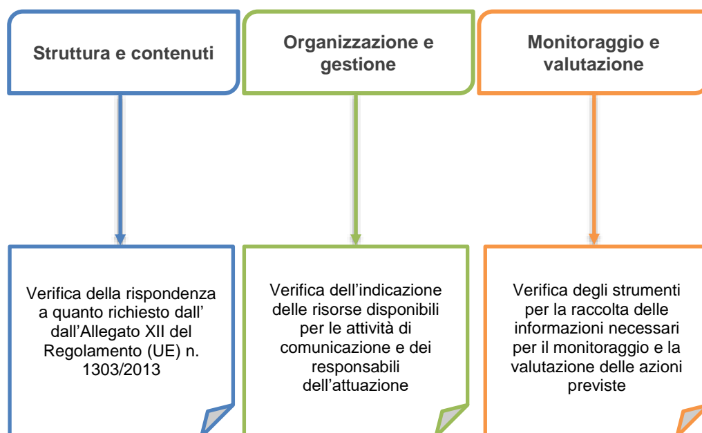
Fig. 1.1 – Le dimensioni e le finalità dell'analisi valutativa

L'analisi valutativa si è concentrata sulle seguenti dimensioni della Strategia di Comunicazione, con riferimento all'Allegato XII del Regolamento (UE) n. 1303/2013 che indica gli elementi che devono essere presenti nel documento: