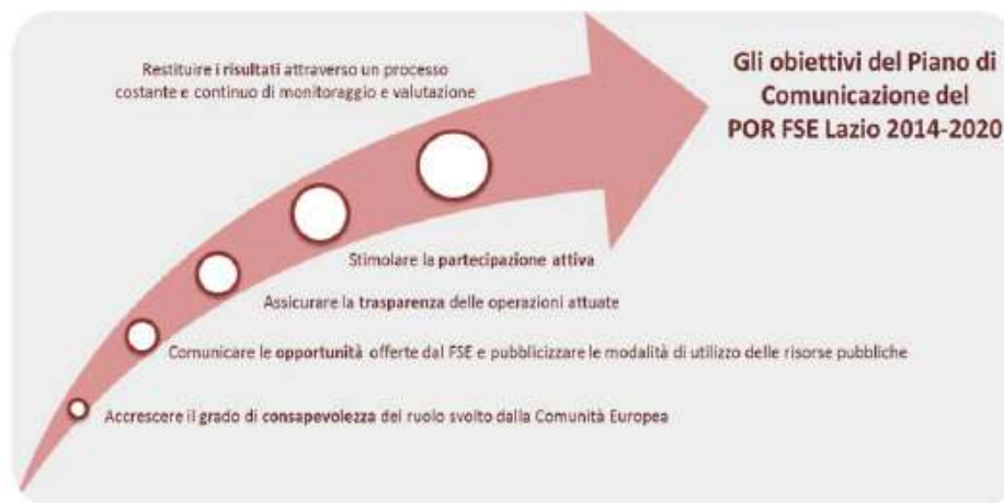
Fig. 1.2 – Gli obiettivi del Piano di Comunicazione del POR FSE 2014-2020

Fonte: Immagine Obiettivi del Piano, Strategia di comunicazione (pag. 38).