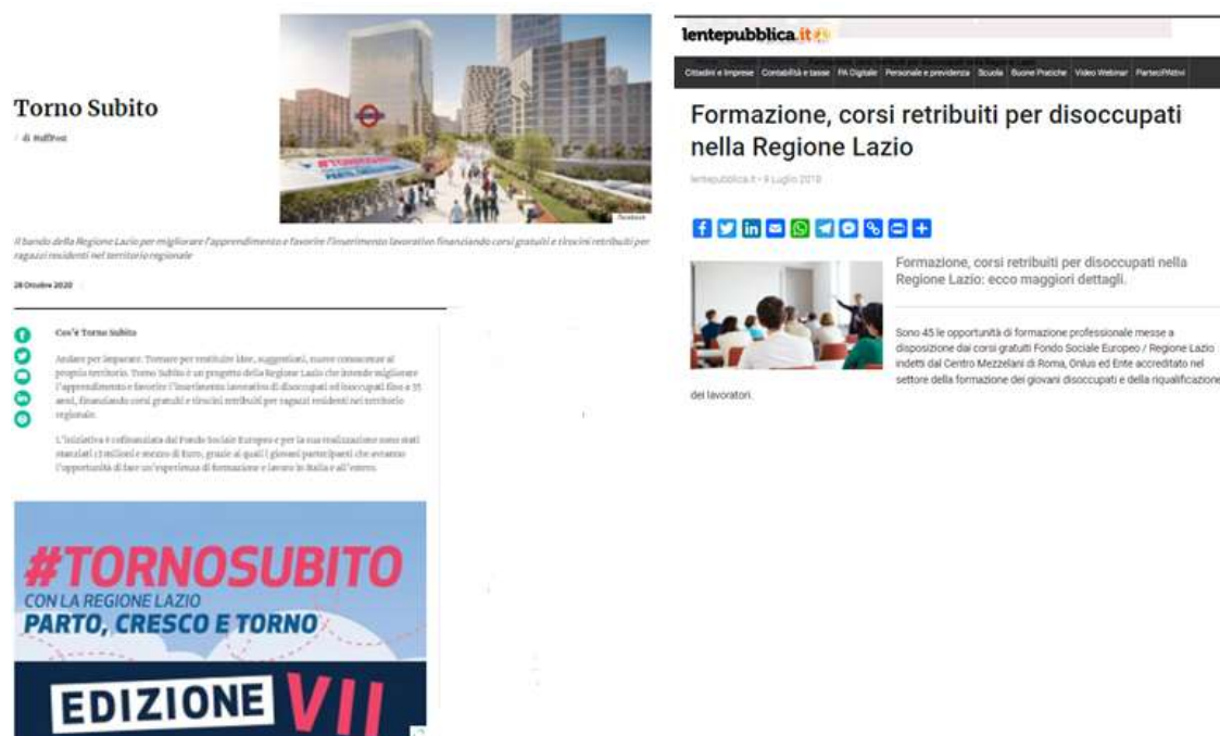
Fig. 2.2 – Articolo su huffingtonpost.it e lentepubblica.it

Ulteriori articoli sulla stampa sono stati individuati nelle informative sulle attività di comunicazione, ed in particolare, relativamente al progetto Alta formazione “Officina delle Arti Pier Paolo Pasolini “Canzone, Teatro, Multimediale” con la pubblicazione di 2 articoli su riviste specializzate (su “Rolling Stones” del 16/12/2015 e su “DireGiovani” del 28/12/2015) ed un altro sul quotidiano nazionale “Il Fatto Quotidiano” del 28/12/2015.