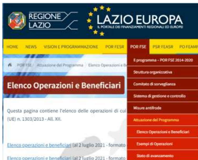
Fig. 2.1 – Pubblicazione dell'elenco dei beneficiati su Lazio Europa/POR FSE

L'ultimo aggiornamento risale al 2 luglio 2021, dunque, risulta necessario pubblicare una nuova versione dell'elenco completa di tutte le operazioni finanziate nell'ultimo semestre. Versione che, invece, risulta più aggiornata (31 ottobre 2021), sul portale Open Coesione.